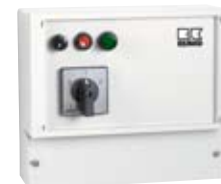
Przełącznik SW 2 380 DI shaft, 2-częściowy