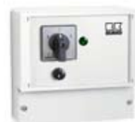
Przełącznik MSRD 2.5 400 V