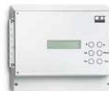
Przełącznik MAK -1